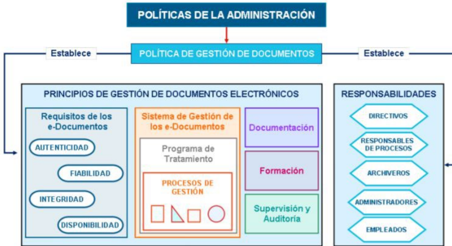
Figura 4. Contexto de la Política de gestión de documentos en la organización.